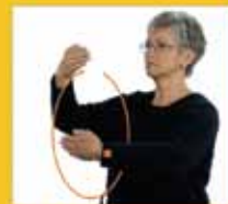
[in] Ewigkeit, Ewigkeit • ewig