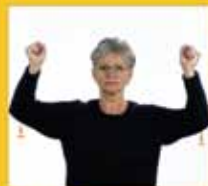
[und die] Kraft Kraft religiös