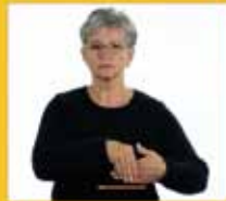
[Und] führe führen