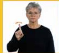
nicht [in] nicht • nein • kein