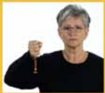
Wille Wille • will