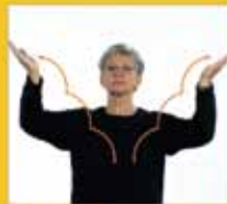
[und die] Herrlichkeit Herrlichkeit