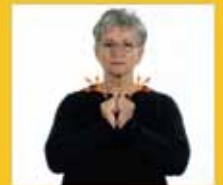
erlöse erlösen • Erlöser • Erlösung