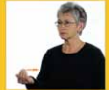
komme, kommen • komme