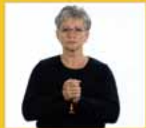
vergeb Vergebung • vergeben • Versöhnung • versöhnen