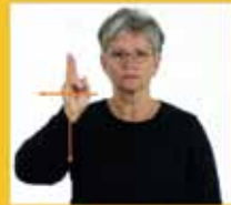
geheilig [werde] Kreuz • heilig