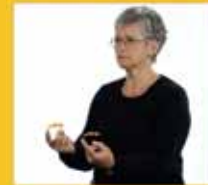
Versuchung, Versuchung • versuchen