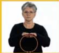
Erde! Ball • Erdball • Weltkugel