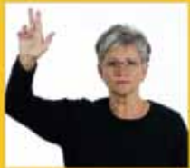
Vater Gott • Allmächtiger Vater religiös