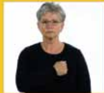
Schuld, Schuld • böse religiös • Sünde