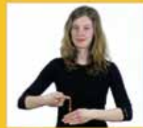
tägliches Tag • täglich