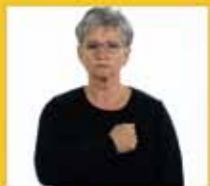
[dem] Bösen! Schuld • böse religiös • Sünde