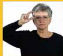
Name, Name • heißen